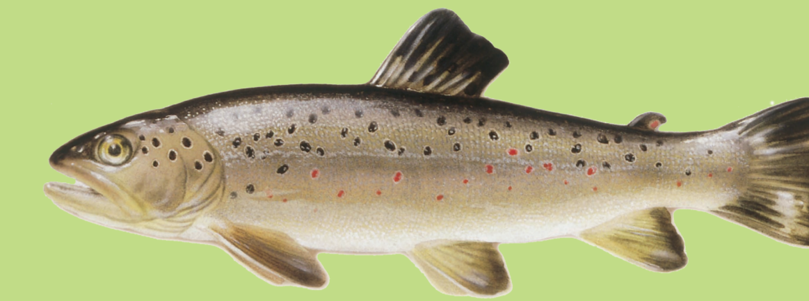
Truite fario (min. 35 cm)